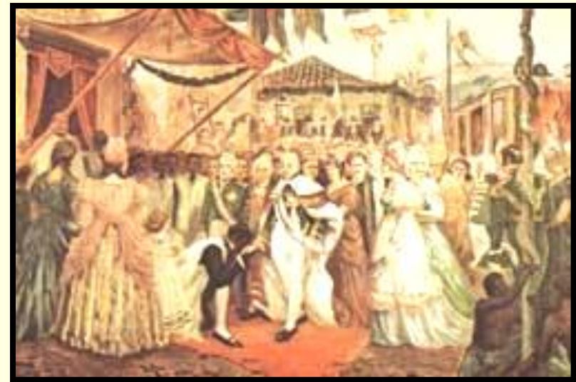
Chegada da família real portuguesa.