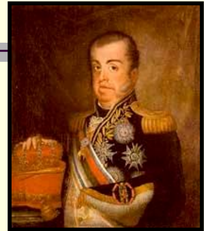
D. João VI